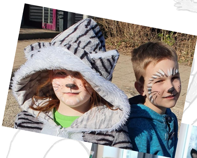
Hier ein paar Eindrücke des spaßigen Tages!