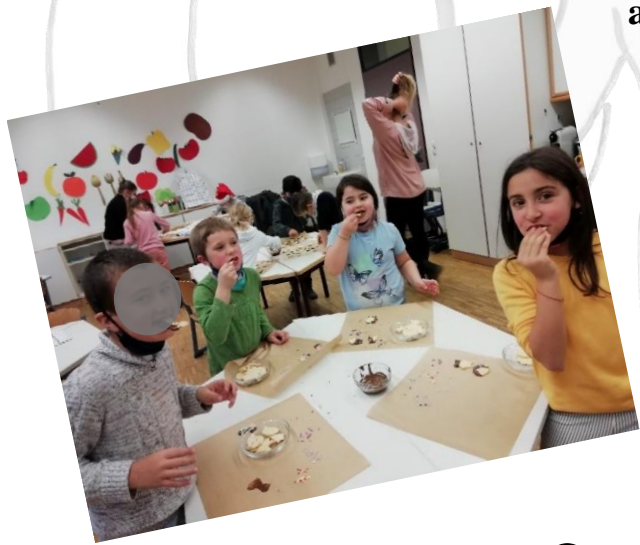
Frosty the snowman... 😊