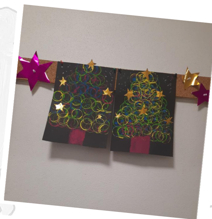
Weihnachtsbäume mit Goldsternen