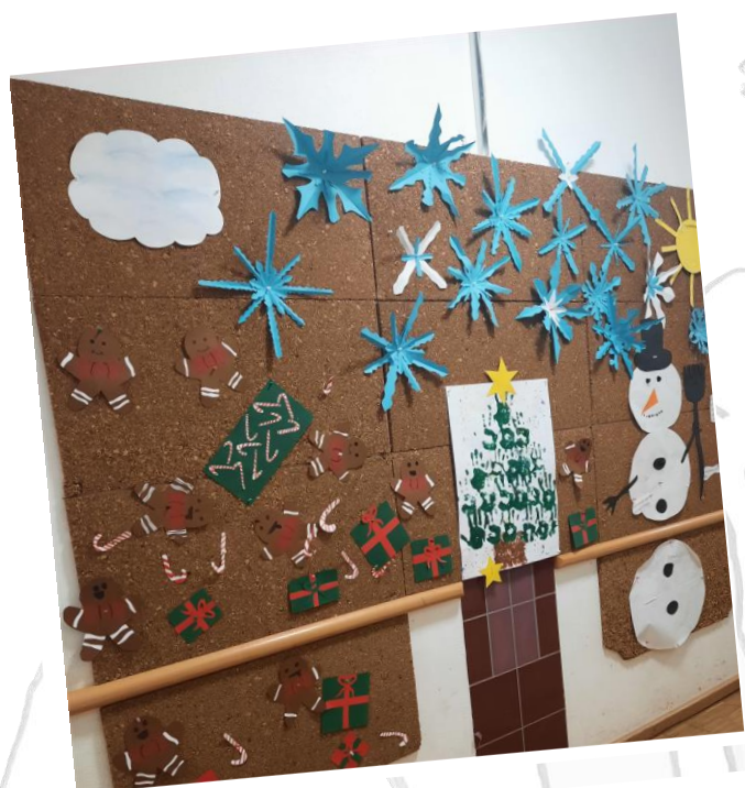
Schneelandschaft mit kleinen Weihnachtsgeschenken